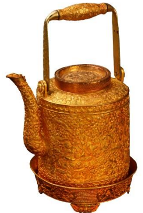
กาพระสุธารส

ต่อมาเมื่อพระบาทสมเด็จพระพุทธยอดฟ้าจุฬาโลก รัชกาลที่ ๑ ทรงสถาปนากรุงรัตนโกสินทร์เป็นราชธานี ทรงพระกรุณาโปรดเกล้าฯ ให้พระยาเพชรพิชัยซึ่งเป็นขุนนางครั้งกรุงศรีอยุธยาเป็นผู้บอกแบบแผนขนบธรรมเนียมประเพณีต่าง ๆ เมื่อครั้งกรุงเก่า ดังนั้นแบบแผนของเครื่องราชอิสริยยศและการพระราชทานเครื่องราชอิสริยยศในสมัยกรุงรัตนโกสินทร์จึงสืบเนื่องมาจากครั้งกรุงศรีอยุธยาและกรุงธนบุรี และมีการพระราชทานเพิ่มเติมต่อมาจนถึงปัจจุบัน สามารถแบ่งเป็นประเภทต่าง ๆ ๗ ประเภท ดังนี้