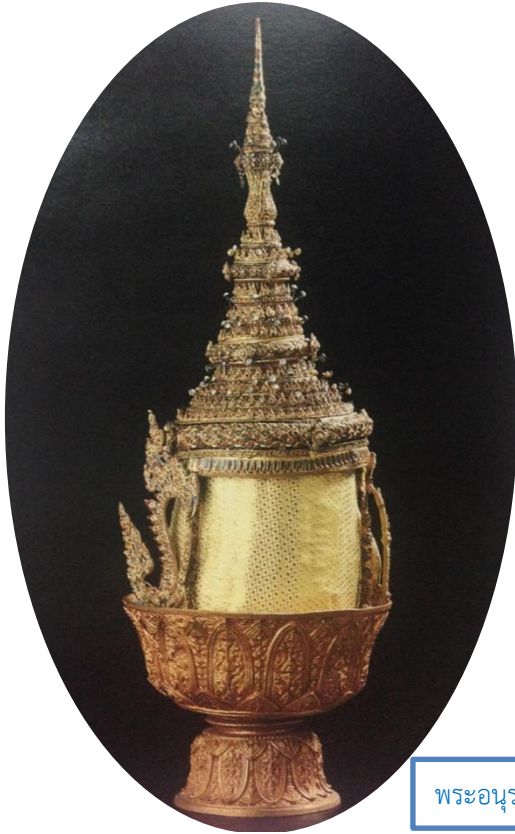
พระอนุราชมงกุฏ

๓. เครื่องภูษณาภรณ์ ได้แก่ เจียรระบาด เสื้อครุย ประกอบเครื่องราชอิสริยาภรณ์