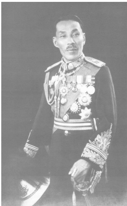
พระเจ้าวรวงศ์เธอ พระองค์เจ้าอ็อดศาร์นุทิศ กรมหมื่นอนุวัตรจาตุรนต์

จึงมีการพระราชทานเครื่องราชอิสริยยศแก่ผู้ที่ได้รับเครื่องราชอิสริยาภรณ์จุลจอมเกล้าด้วย