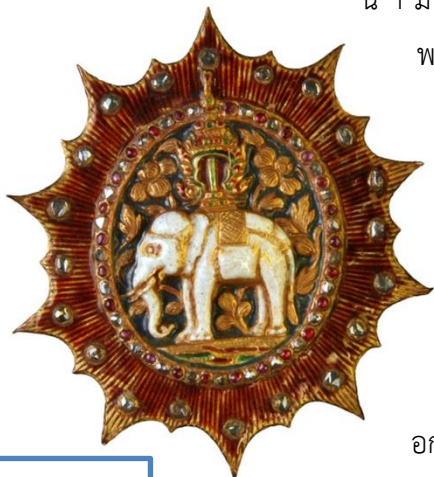
ดาราช้างเผือก