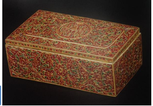
หีบพระศรี

๒. เครื่องศิราภรณ์ ได้แก่ พระอนุราชมงกุฏ พระมาลาเส้าสูง พระมาลาหุ้มตาต