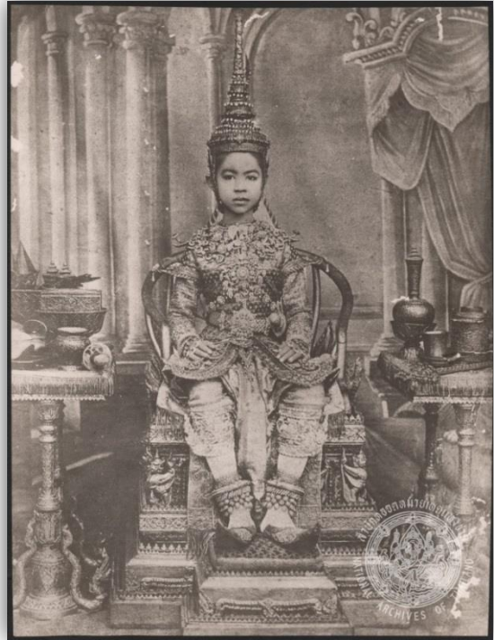
สมเด็จพระบรมโอรสาธิราช เจ้าฟ้ามหาวชิรุณหิศ สยามมกุฎราชกุมาร ในพระราชพิธีโสกันต์

ในรัชกาลพระบาทสมเด็จพระจุลจอมเกล้าเจ้าอยู่หัว ทรงพระกรุณาโปรดเกล้าฯ ให้ปรับปรุงและเพิ่มเติมดวงตรา ดารา และสายสะพาย กำหนดชื่อชั้นและตราพระราชบัญญัติเครื่องราชอิสริยาภรณ์ตระกูลต่างๆ ขึ้น แต่ประเพณีการพระราชทานเครื่องราชอิสริยยศก็ยังคงปฏิบัติสืบทอดต่อมา โดยทรงพระกรุณาโปรดเกล้าฯ ให้พระราชทานเครื่องราชอิสริยยศแก่สมเด็จพระเจ้าลูกยาเธอ สมเด็จพระเจ้าลูกเธอในพระราชพิธีโสกันต์ ๒๑ และพระราชทานเพิ่มเติมในการสถาปนาพระอิสริยยศเป็น เจ้าต่างกรม และใน พ.ศ. ๒๔๑๖ ทรงพระกรุณาโปรดเกล้าฯ ให้สถาปนาเครื่องราชอิสริยาภรณ์จุลจอมเกล้าขึ้น และทรงกำหนดให้มีการพระราชทานเครื่องราชอิสริยยศประกอบเครื่องราชอิสริยาภรณ์จุลจอมเกล้า