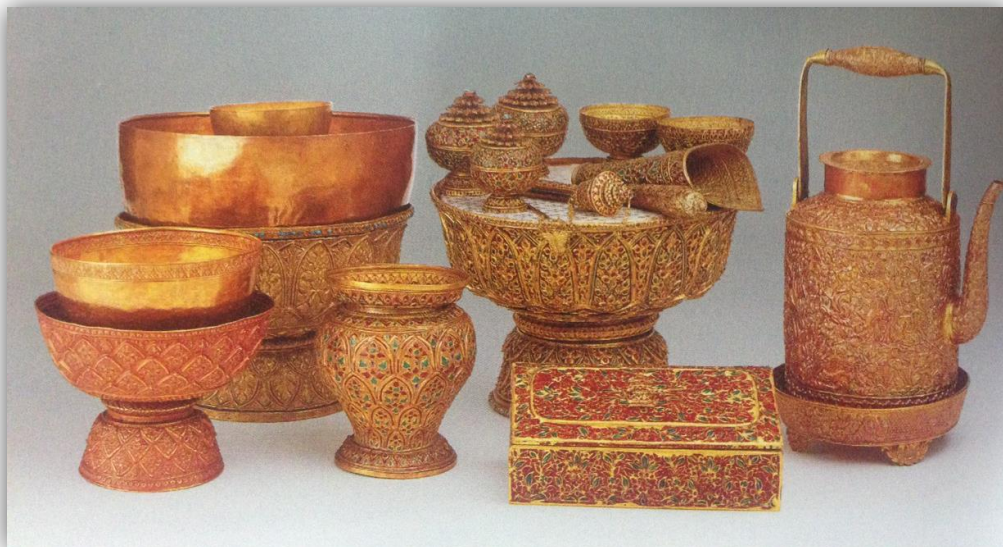
เครื่องประกอบพระราชอิสริยยศเจ้านายฝ่ายใน ชั้นเจ้าฟ้า

สังคมไทยตั้งแต่อดีตนับแต่สมัยกรุงสุโขทัยเป็นราชธานี พระมหากษัตริย์เป็นผู้มีพระราชอำนาจสูงสุดในราชอาณาจักร ทรงปกครองบ้านเมืองเพื่อประโยชน์สุขของประชาราษฎร์ภายใต้ทศพิธราชธรรม ในการบริหารราชการแผ่นดินนั้น พระบรมวงศานุวงศ์และข้าราชการเป็นผู้ทำราชการต่างพระเนตรพระกรรณ เพื่อแบ่งเบาพระราชกิจ ผู้ที่รับราชการแผ่นดินจะได้รับศักดิ์นา ยศ ราชทินนาม และตำแหน่ง เป็นเครื่องชี้บอกถึงอำนาจและเกียรติยศ โดยพระมหากษัตริย์จะพระราชทานเครื่องราชอิสริยยศเพื่อปกป้องฐานานุกรมศักดิ์ในสังคม และเป็นบำเหน็จรางวัลในการประกอบความชอบในราชการแผ่นดิน ซึ่งเครื่องราชอิสริยยศเหล่านี้จะต้องถวายคืนเมื่อได้รับในชั้นสูงขึ้น ถึงแก่กรรมหรือพ้นจากหน้าที่ราชการ