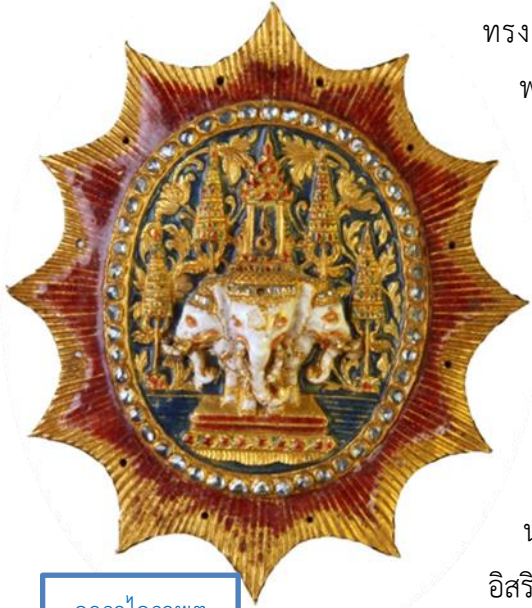
ดาราไอรภาพ

กระทั่งในรัชกาลพระบาทสมเด็จพระจอมเกล้าเจ้าอยู่หัว รัชกาลที่ ๔ ทรงพระกรุณาโปรดเกล้าฯ ให้สร้างเครื่องราชอิสริยยศประดับอัญมณีคล้ายเครื่องหมายแบบชาวตะวันตก เมื่อ พ.ศ. ๒๔๐๐ เป็นดาราไอรภาพ โดยทรงนำแบบอย่างมาจากลวดลายของตราพระราชลัญจกรไอรภาพ ทรงสร้างสำหรับเป็นเครื่องต้น ๒ องค์และพระราชทานพระบาทสมเด็จพระปิ่นเกล้าเจ้าอยู่หัว ๒ องค์