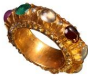
อัมรงคันทน์

๕. เครื่องสิริมงคล เช่น ประคำทองคำ อัมรงคันทน์