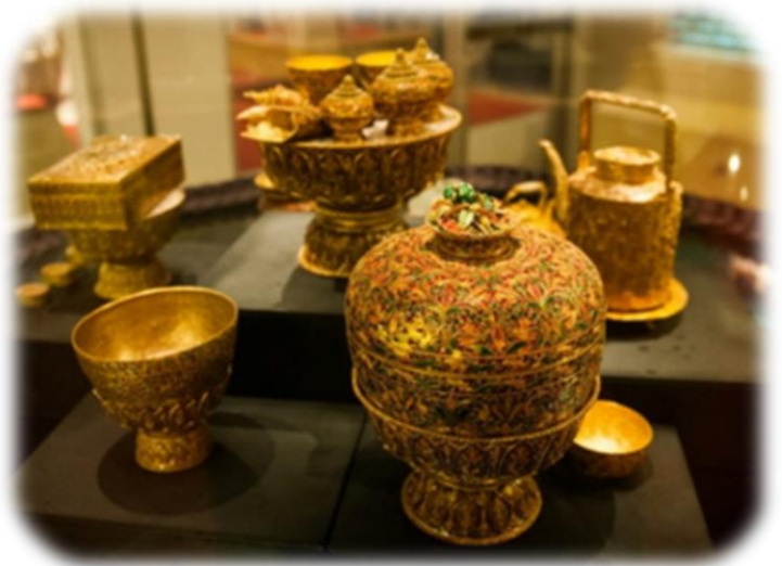
เครื่องประกอบพระราชอิสริยยศ สมเด็จพระเทพรัตนราชสุตาฯ สยามบรมราชกุมารี

ปัจจุบันเครื่องราชอิสริยยศ อันเป็นทรัพย์สินมีค่าของแผ่นดินได้รับการดูแลรักษาโดยสำนักทรัพย์สินมีค่า ของแผ่นดิน และมีการคัดเลือกนำมาจัดแสดงภายในศาลาเครื่องราชอิสริยยศ เครื่องราชอิสริยาภรณ์ และเหรียญกษาปณ์ ในพระบรมมหาราชวัง โดยมีการจัดแสดงเครื่องประกอบพระราชอิสริยยศสมเด็จพระเทพรัตนราชสุตาฯ สยามบรมราชกุมารี เครื่องประกอบพระราชอิสริยยศพระเจ้าวรวงศ์เธอ พระองค์เจ้าโสมสวลี พระวรราชาทินัดดามาตุ เครื่องราชอิสริยยศประเภทต่างๆ ผู้สนใจสามารถเข้าชมได้ทุกวัน ตั้งแต่เวลา ๘.๓๐ -๑๖.๐๐ น. (ยกเว้นวันที่มีพระราชพิธี)